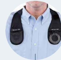
Den Ladekragen oder und das dazugehörige Gegengewicht